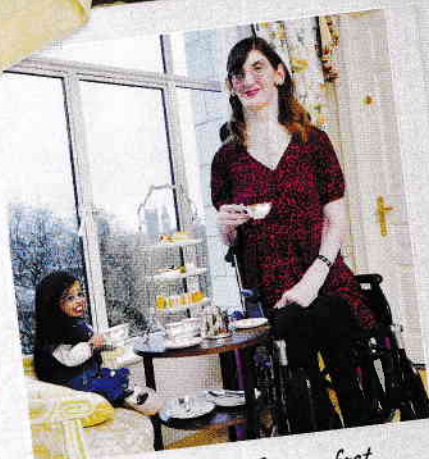
Ceaiul servit la hotelul Savoy a fost binevenit într-o zi plină cu ședințe foto, interviuri și vizite la obiective turistice.